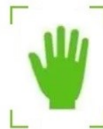
Biometria Palma da Mão